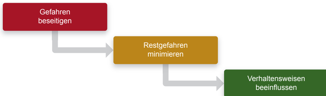
Abbildung 1: AN-Schutzziele