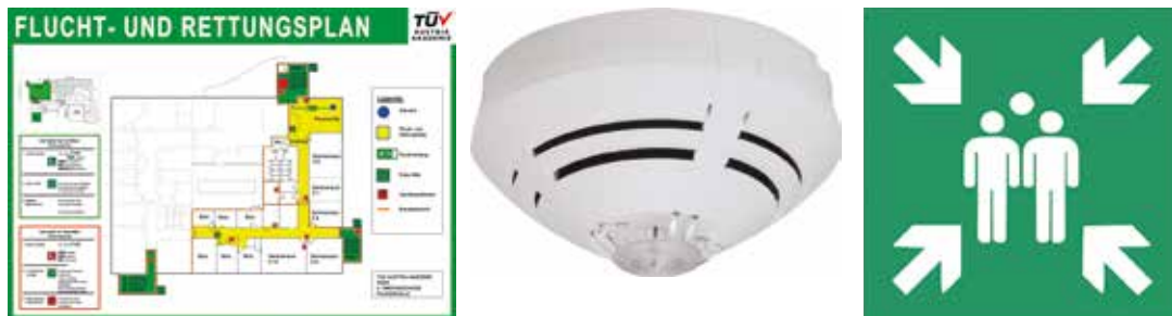
Abb. Technisches Notfallmanagement

Die ISO 14001-Komponente der betrieblichen Notfallvorsorge ist die Dokumentation, die inhaltliche Komponente sind die österreichischen Gesetze, Verordnungen und verbindlichen Normen, wie die Technischen Richtlinien Vorbeugender Brandschutz (TRVB) O 119 – O 128.