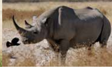
Notfallvorsorge und Gefahrenabwehr