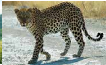
Umweltaspekte und -auswirkungen