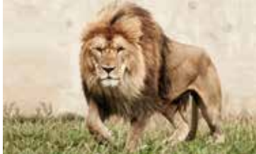
Betriebliche Planung und Steuerung