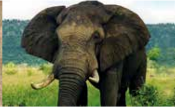
Umweltrecht und Bewertung